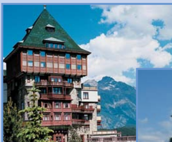
Badrutt's Palace, St. Moritz