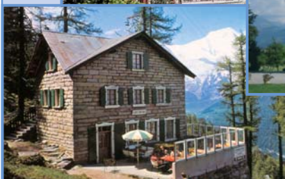
Cafe Triftalp, Saas-Grund