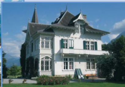
Haus Rüdli, Thuner See